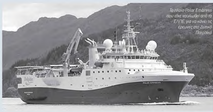
Το πλοίο Polar Embress που είχε ναυλωθεί από τη ΕΔΕΥ για να κάνει τις έρευνες στο Δυτικό Πατράϊκο

Η απόφαση για απολιγνιτοποίηση κατά την γνώμη μου, επισπεύδει την ανάγκη να ολοκληρωσουμε το πρόγραμμα εξερεύνησης και εκμετάλλευσης υδρογονανθράκων και ειδικά του φυσικού αερίου. Ο ισχυρισμός αυτός προκύπτει αβίαστα καθώς, η ενεργειακή μετάβαση η οποία απαιτείται για την ανατροπή της κλιματικής αλλαγής επιβάλλει την υιοθέτηση άμεσων λύσεων, τεχνολογικά εφικτών και οικονομικά ανεκτών. Εως σήμερα το φυσικό αέριο αποτελεί το μοναδικό και παγκόσμια αποδεκτό καύσιμο-γέφυρα που μας επιτρέπει να υλοποιήσουμε τους στόχους μας. Είναι συνεπώς σαφές ότι προκει-